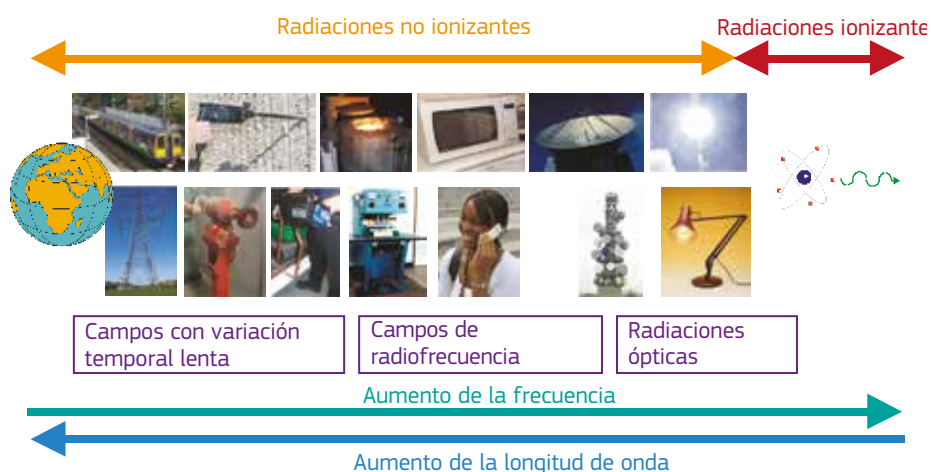
Figura 3.1. Representación esquemática del espectro electromagnético con indicación de algunas fuentes típicas

La finalidad de esta guía es proporcionar a los empresarios información sobre las fuentes de campos electromagnéticos existentes en el entorno laboral, para ayudarlos a decidir si es necesario realizar una evaluación adicional de los riesgos derivados de los campos electromagnéticos. El alcance y la magnitud de los campos electromagnéticos producidos dependerán de las tensiones, intensidades y frecuencias que utilice o genere el equipo, junto con su diseño. Algunos equipos pueden estar diseñados para generar intencionadamente campos electromagnéticos externos. En este caso, un pequeño equipo de baja potencia puede dar lugar a campos electromagnéticos externos significativos. Generalmente requieren una evaluación adicional los equipos que utilizan intensidades elevadas o altas tensiones y los que están diseñados para emitir radiaciones electromagnéticas.